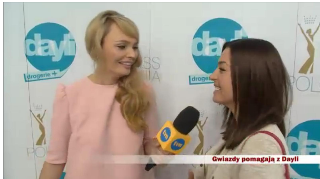
Gwiazdy pomagają z Dayli